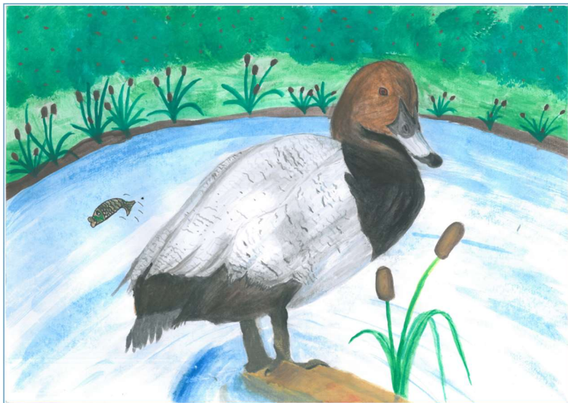
„Pták roku 2023 – polák velký“ (výtvarná soutěž)