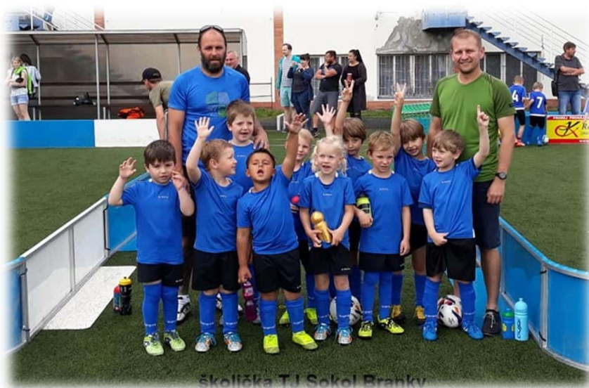
školička TJ Sokol Branky