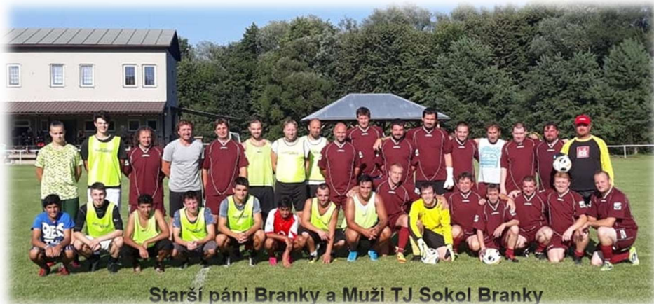
Starší páni Branky a Muži TJ Sokol Branky

Vážení sportovci, fandové, spřízněné duše, které nás podporují, začnu tento příspěvek tím, že jsme téměř po půl roce začali hrát soutěže. Fandové byli hladoví a těšili se na zápasy. Soutěž mužů se podařilo rozčlenit do tří skupin, a to je dobré pro všechny, protože budeme hodně zápasů hrát v okruhu cca deseti kilometrů, obrazně řečeno, hrajeme „kolem komína“. Muži i žáci trénují, uvidíme, jak si povedou. Zatím máme střídavé úspěchy, žáci jsou na tom lépe. Někdy nám štěstí