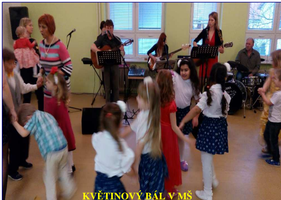
KVĚTINOVÝ BÁL V MŠ