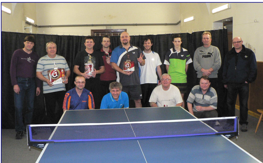
TURNAJ VE STOLNÍM TENISE