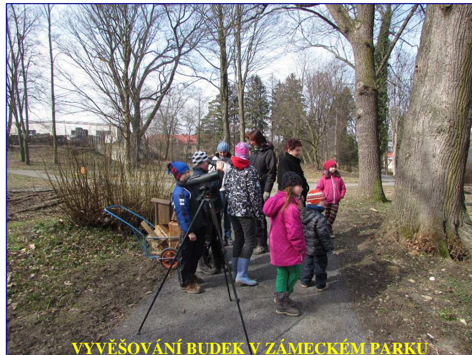
VYVĚŠOVÁNÍ BUDEK V ZÁMECKÉM PARKU